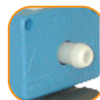
Diamètre de passage 10 mm