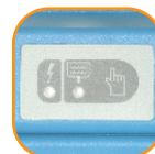
Voyant de décharge Voyant de mise sous tension Test de purge manuel