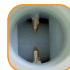
Contacts traités anti-corrosion