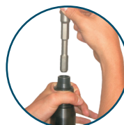
14,7 mm Hexagonal